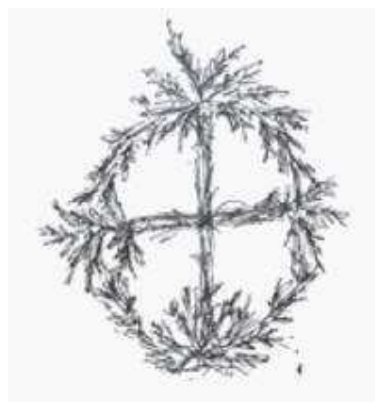
Couronne ( cunună )