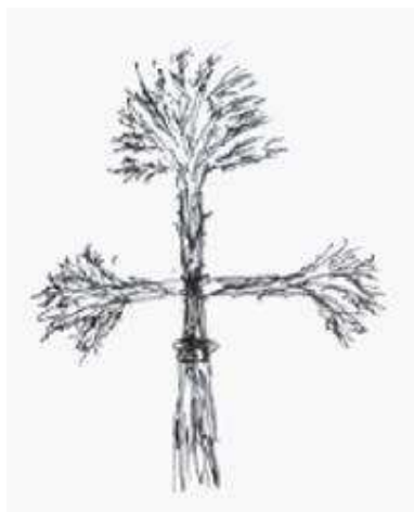
Massues du blé ( Buzdugan )

Buzdugane (Massues du blé), en forme de croix, provenant du sud de la Transilvanie (la region du Olt e du Sibiu – Mărginimea Sibiului)