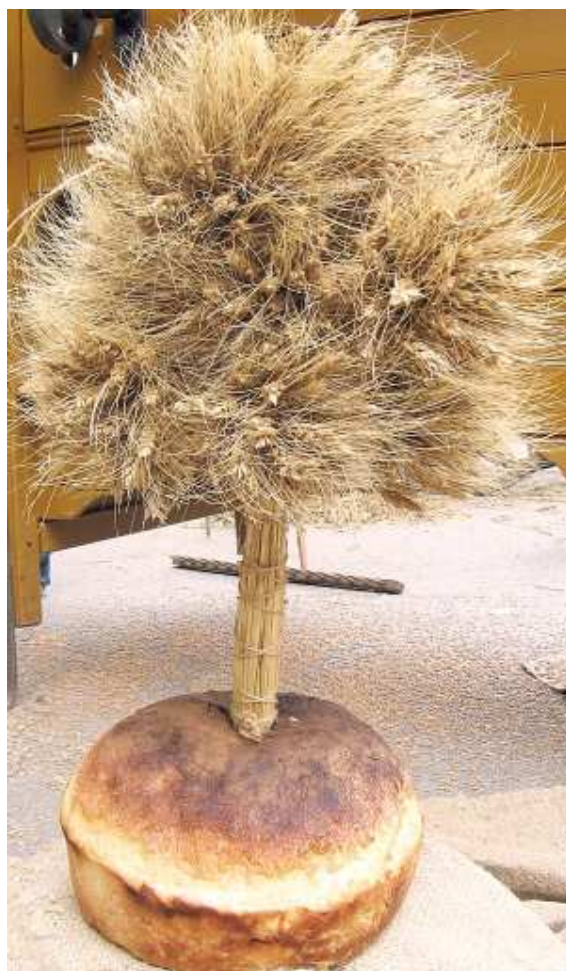
Buzdugan (Massue du blé) 1