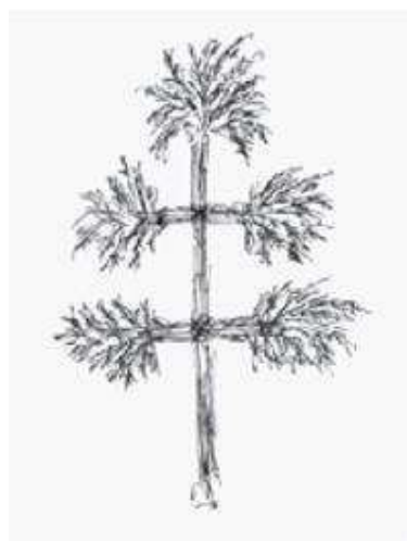
Buzdugan en forme de croix byzantine (Drăguș, Brașov)